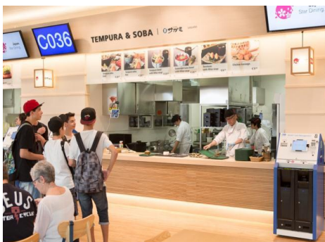
5月1日から10月31日まで ミラノ万博日本館に出店いたしました