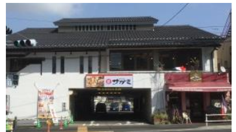
3月17日にグランドオープンした 和食麺処サガミいずみ中央店