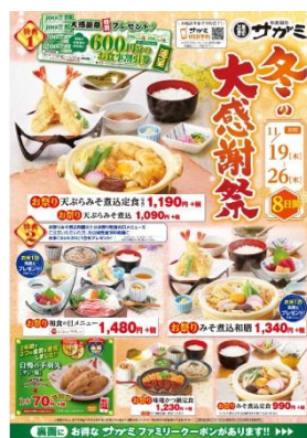
『冬の大感謝祭』ポスター