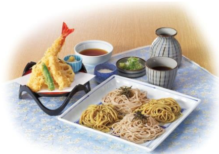
『満天きらりの韃靼そばと石挽そば』