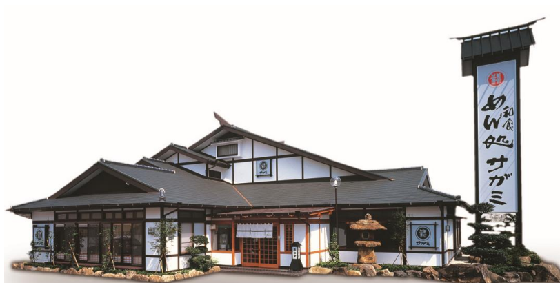
和食麺処サガミ 外観イメージ